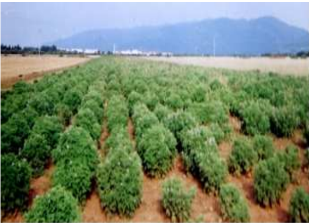
Figure 1: Champ de culture de géranium rosat à Chiffa.

Ces géraniums, dont le nombre avoisine les 600 plants, ont été bouturés en octobre 2004 avec des écartements aléatoires et une densité de 2 à 4 plants/m 2 . L'identité et la systématique de la plante ont été confirmées au Jardin d'Essais d'Alger.